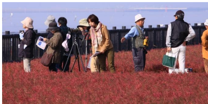
有名な海の紅葉「シチメン草」も見られます

シギ・チドリ飛来数日本一を誇る 東与賀干潟は 2015年のラムサール条約の登録 を目指しています。