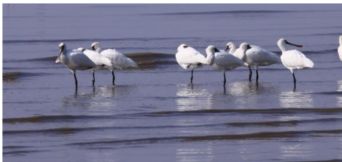
絶滅の恐れがある渡り鳥、「クロツラヘラサギ」 などが観察できます