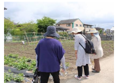
えんJOYねっと取材の様子