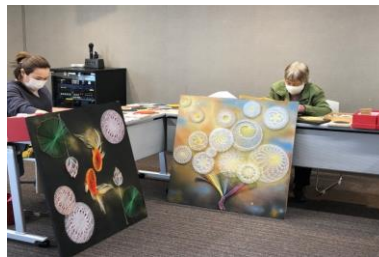
「糸掛け教室」の様子