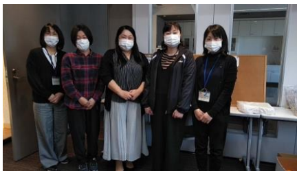
「スタッフの皆さん」