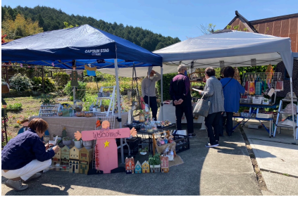
★多肉植物やハンドメイド

趣味で作成した作品を持ち寄りマルシェを定期的に関催されています。そこで生まれた交流を更に深めるため、ワークショップなどを行い、提供する側求める側すべてが生き活きとなれることを目指されています。 また、マルシェで得た売り上げ金の一部は社会福祉協議会へ寄付されています。