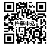
2次元コードより申込 できます。