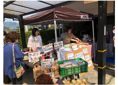
★煮卵が入ったおむすびなど