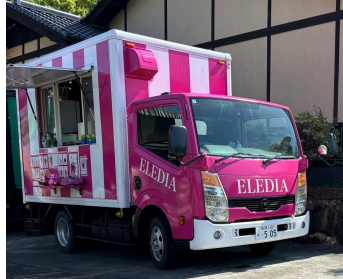
★キッチンカーやピザ屋