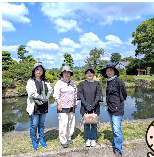
6/4の取材では、小城公園を歩かれてました！