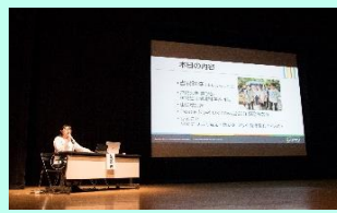
(昨年度ピースアクションより)