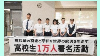
(昨年度ピースアクションより)