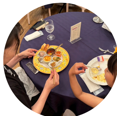
美味しいね～ 一組ずつ記念写真を 撮ってくれました。