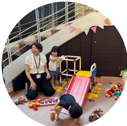
子どもたちはark.のスタッフにお任せ！ 皆の大切な時間、お母さんゆっくり 楽しんでくださいね♪