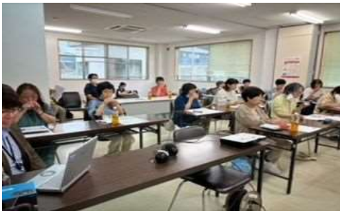
きき牛乳も行いました。意外な結果が！！