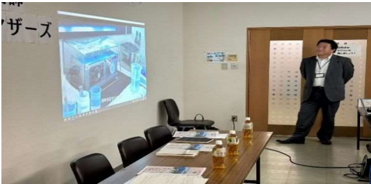
牛乳が商品化されるまでをVTRで学びました！