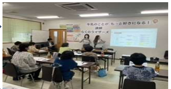
生乳から様々な製品が作られる課程を学びます