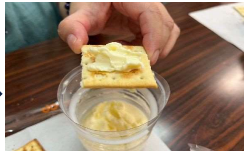
とっても美味しいバターの出来上がり！ 手作りバターは体にもいいんです！