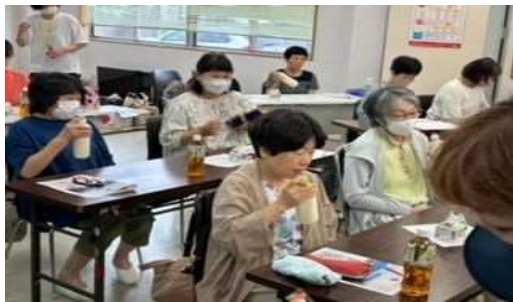
「お楽しみのバター作り」