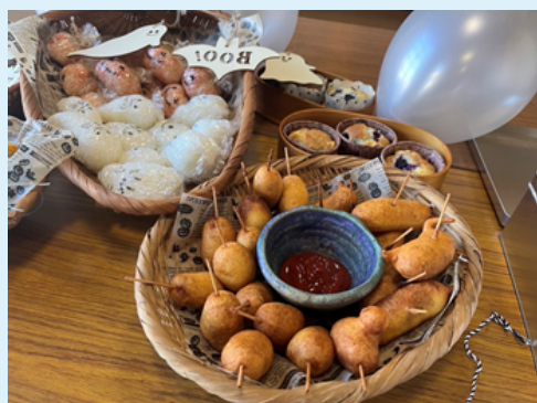
頂いた食品を使って おいしいごはんやおやつができました

2023年度は企業・団体、個人の方から約67.3トンの食品・日用品をご寄付いただきました。 昨年度コープさが生協のみなさまよりいただいたのは1,641kgにもなり、みなさまからのご寄付は、フードバンクの活動の大きな力となっています。フードドライブで集まった食品は、素材から加工食品までさまざまです。調理して提供するこども食堂から調理が難しい方への提供までさまざまな場面で活用させていただいています。