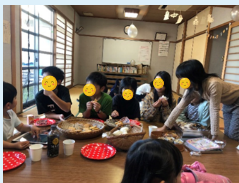
鳥栖市「子どもの居場所 きざとわたげ」