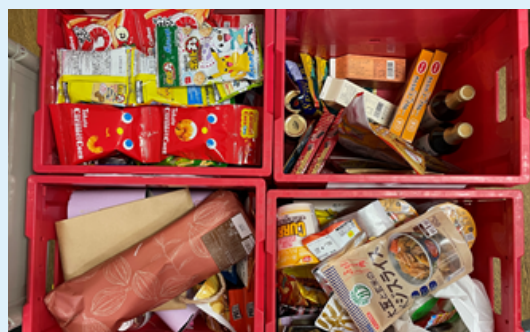
新栄店のフードドライブで集まった食品

2023年度は企業・団体、個人の方から約67.3トンの食品・日用品をご寄付いただきました。 昨年度コープさが生協のみなさまよりいただいたのは1,641kgにもなり、みなさまからのご寄付は、フードバンクの活動の大きな力となっています。フードドライブで集まった食品は、素材から加工食品までさまざまです。調理して提供するこども食堂から調理が難しい方への提供までさまざまな場面で活用させていただいています。