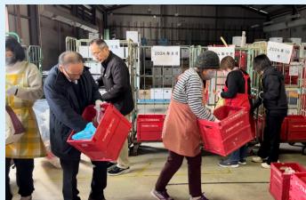
組合員のボランティアのみんなで集まった食品を仕分けしました