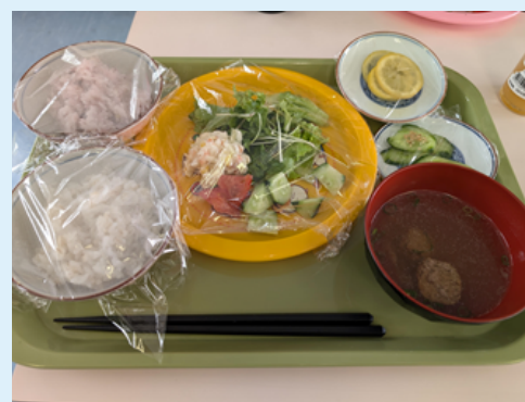
佐賀市「みんなdeつくろう会」