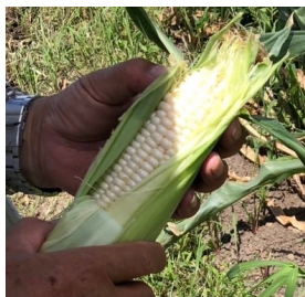
〈白いとうもろこし〉