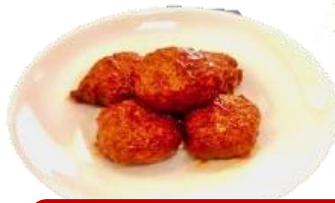
ミートボール ミートソース煮