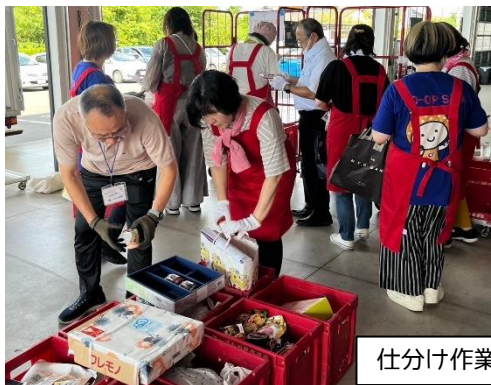
仕分け作業の様子

～第9回フードドライブ～ みなさまから寄付いただいた食品や 非食品の仕分けを行いました。