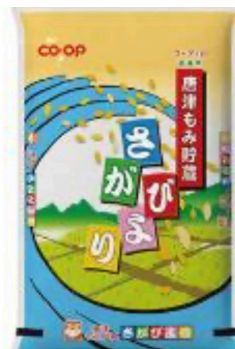
(対象商品の一例です)

対象商品：カタログ「る〜ぶ」お米コーナーにある ”株式会社JA食糧さが”が製造する商品