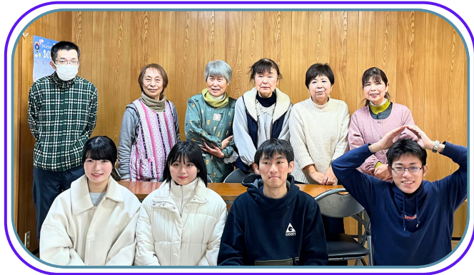
スタッフの皆さん

子ども達はお腹がいっぱいになると、それぞれ遊びに行きます。専福寺の本堂や八坂神社では、危なくないようにスタッフに見守られ、ボランティアの佐賀大学の学生さんと遊ぶ姿を見ました。寒い中でも元気いっぱい楽しげな声があふれていました。